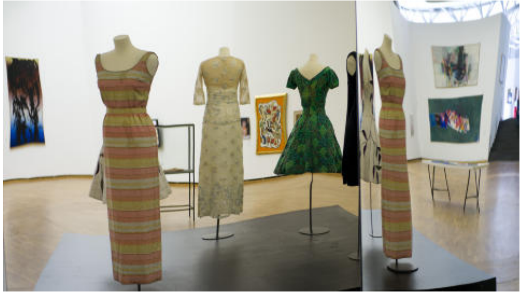
Glamour: Sonja Henies kjoler og skøytekostymer var overdådige. Blant kjolene er kreasjoner fra Balenciaga og en «pokerkjole» fra Las Vegas.